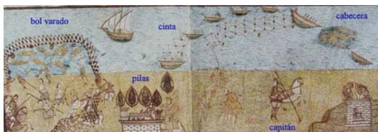
Grabado de pesca del atún con almadraba

Existían dos grandes patios, cuyos estados actuales coinciden sensiblemente con sus respectivos trazados originales. Uno adosado a la fachada norte, donde estaba hace poco nuestra palmera y que se destinaba a almacén de barcos. Aquí se encontraban los Postres de la Ramada, que era donde se colgaban los atunes para limpiarlos y hacerlos cuartos y donde se celebraba la subasta. El otro patio, de mayor superficie que el anterior, es el que ocupaba actualmente la zona posterior del recinto y que está delimitado por la muralla exterior en sus linderos sur, este y oeste.